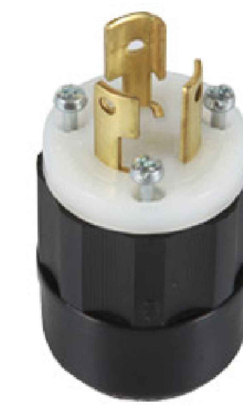
Ejemplos de contacto y clavija para instalacion de equipos modelo libre a escoger segun el cliente

CLIENTE: ADMINISTRADORA AURIGA SA DE CV No. de cliente 12585-1153