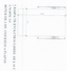
2- RAMPAS TR-EVOLUTION LIBRES DE 2.10 X 3.75 METROS (10) MOTORES DE 3 HP- CONEXION A PLAIN