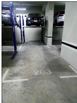
LUGAR DONDE SE INSTALA EL EQUIPO

Ejemplos de contacto y clavija de medida vuleta para 220 volts de 30 amp (el cliente elige el modelo de los accesorios)