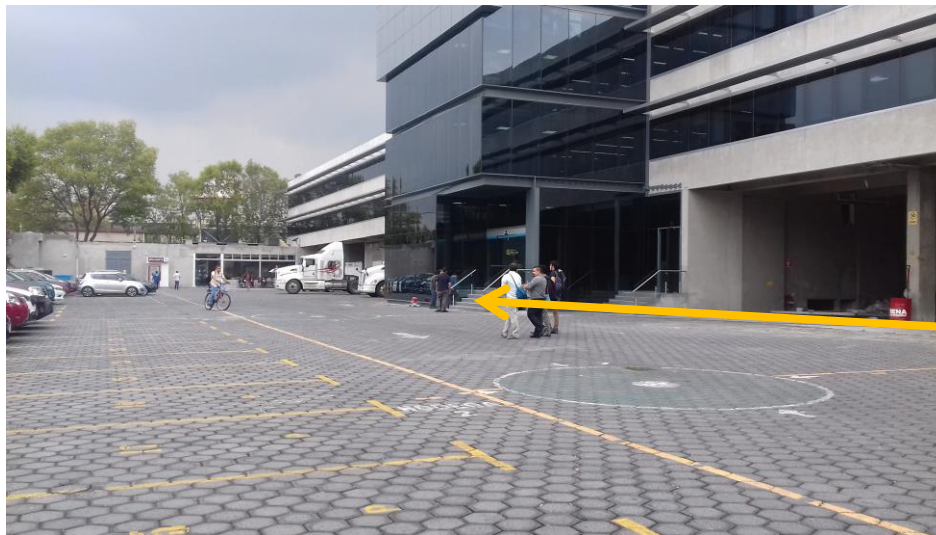
Área de Elevador