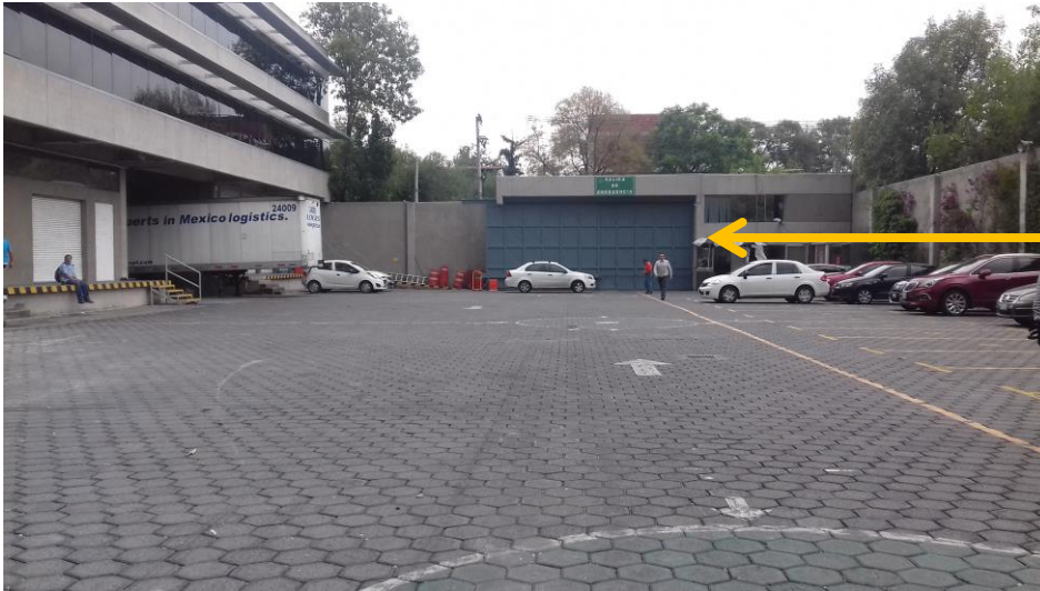
Acceso de calle a estacionamiento