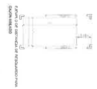
Equipo de seguridad de resguardo para rampa