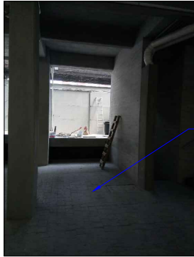
LUGAR DONDE SE INSTALA EQUIPO