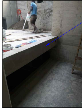
TRABE DE REFERENCIA PARA DISTANCIA DE RESGUARDO