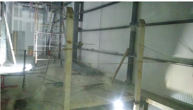
Travesaño a 2.35 mts