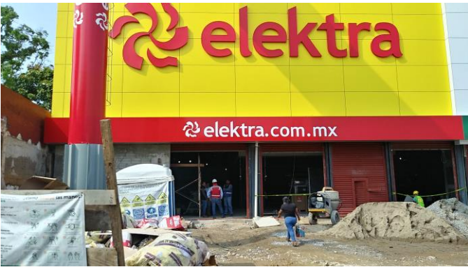
Zona de descarga