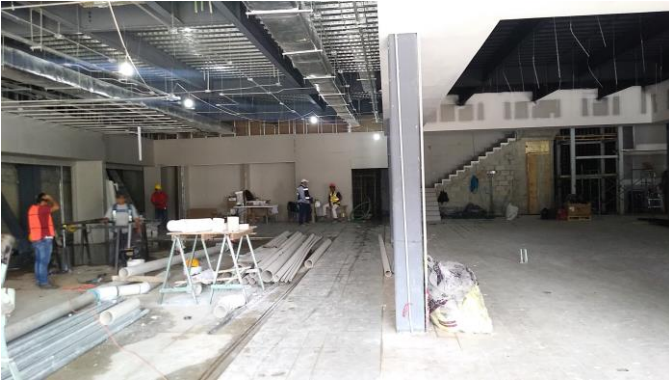
Acceso a la estructura