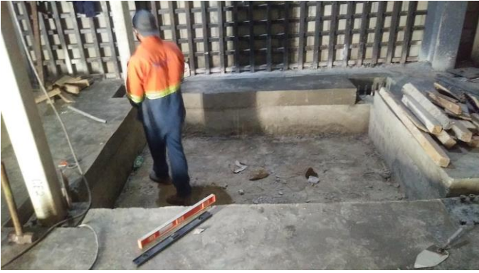
Medidas del foso correctas 2.2x2.8 mts