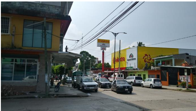
Acceso Frente de Copel