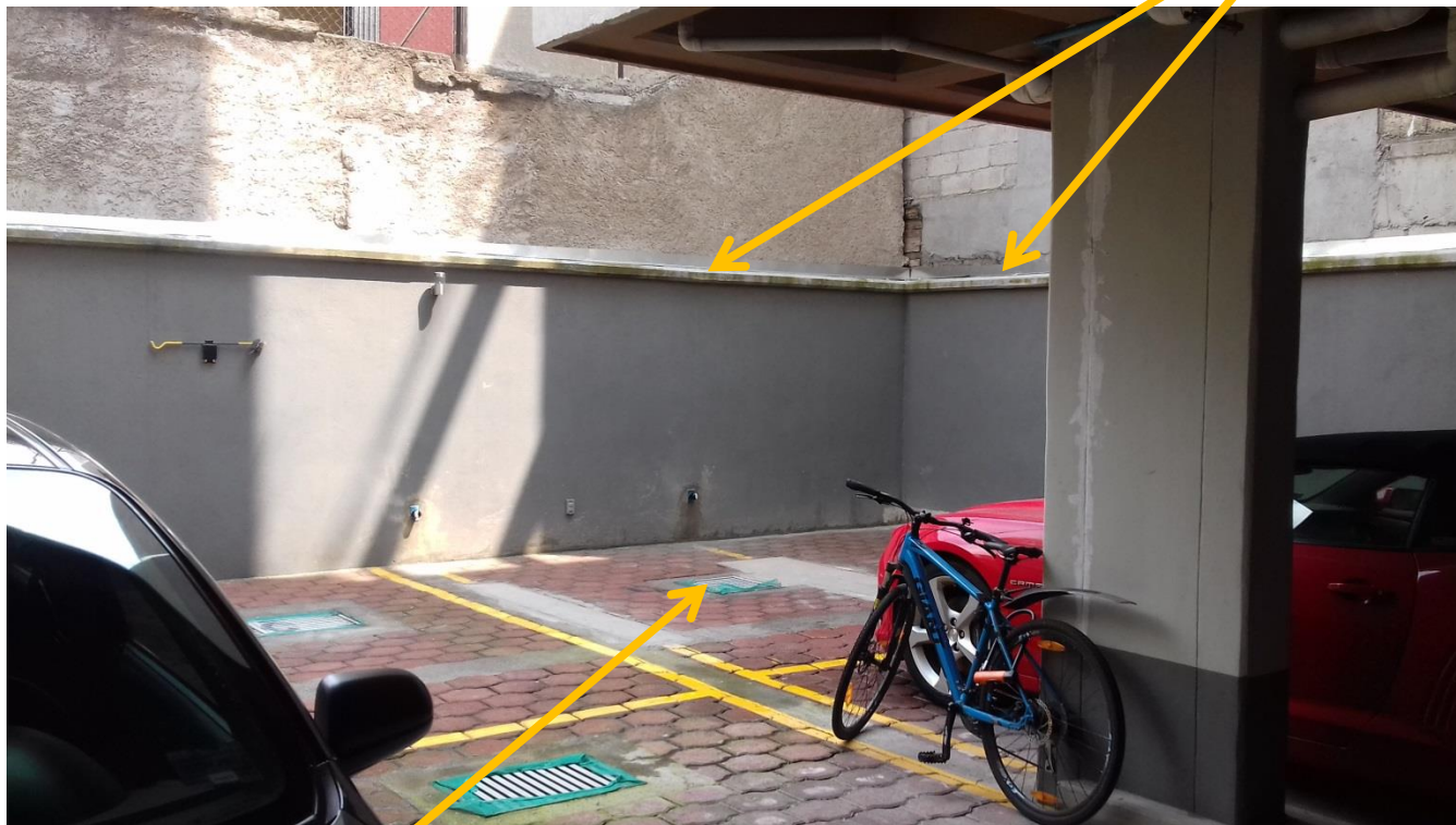
CAJÓN 1. INSTALACIÓN INFERIOR.