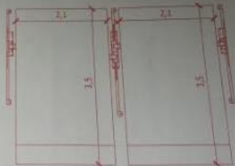
RAMPAS EMPATADAS TR EVOLUTION 2.10M X 3.50M

Osai Soto Hoppe Ing. Osai Soto Hoppe 21/Dic/2017