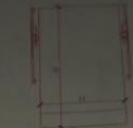
RAMPA TR EVOLUTION 2.10M X 3.50M