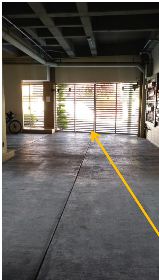
ACCESO, VIENE DE CALLE