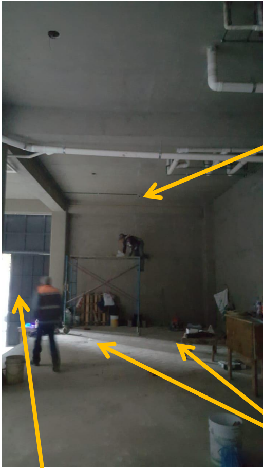
ACCESO, VIENE DE CALLE